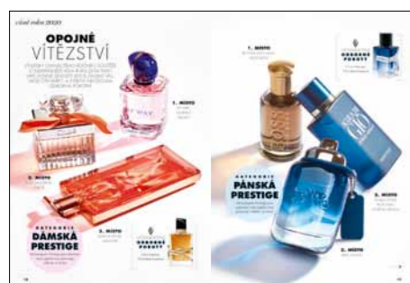
Již po čtrnácté jsme vyhlásovali Vůně roku.